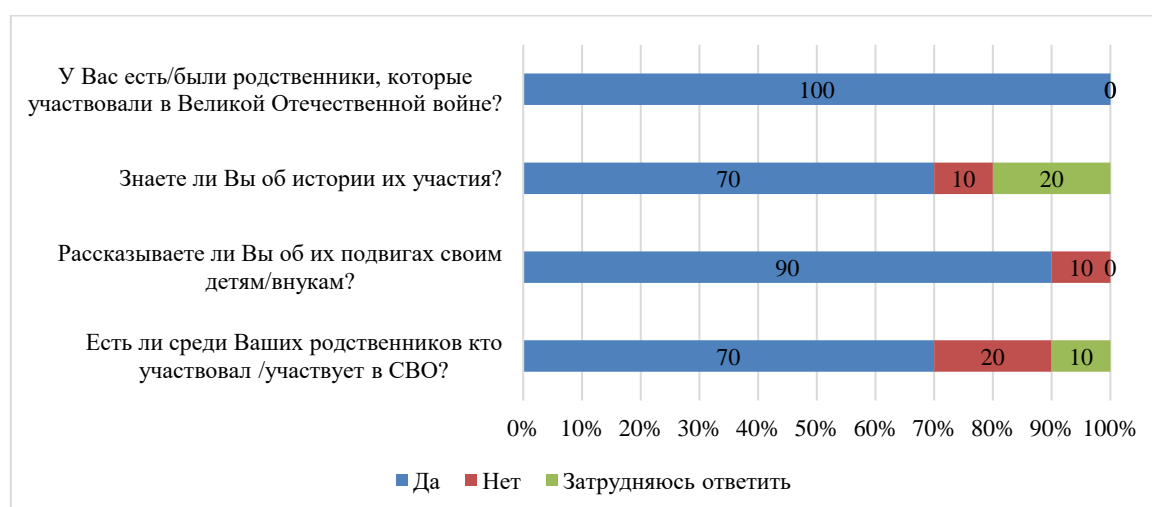
Рисунок 2. Результаты опроса группы в возрасте от 23 до 70 лет

В опросе приняли участие жители Пермского края в возрасте от 23 до 70 лет, среди которых 95 татар и 5 башкир. По религиозной принадлежности группа составила 100 % людей, исповедующих религию ислам.